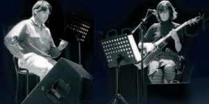
Il quadro è di Maurizio CAMPOSEO (collezione Galvanin)

Tutti gli incontri si svolgeranno al TEATRO CINEMA SAN PIETRO alle ore 21.00